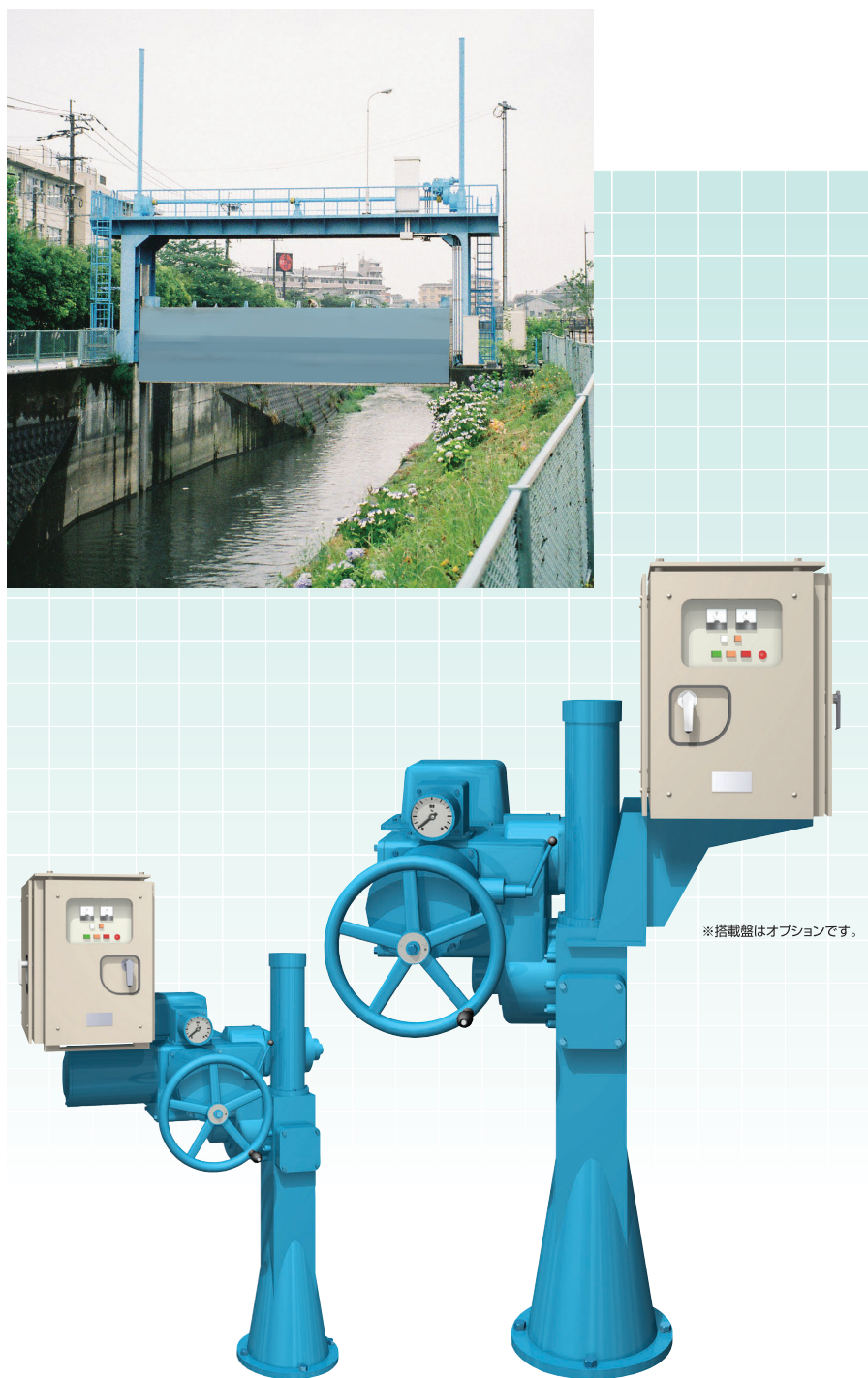
※搭載盤はオプションです。